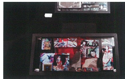
2013年燐寸アート展の様子