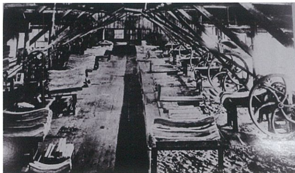
明治時代苫小牧で稼働していたマッチ工場

苫小牧は明治20年代(1890年代)より、新しい産業としてマッチ軸木、小函素地工場が相次いで誕生しました。生糸、茶、綿花などと共に日本を代表する産業として発展。苫小牧が工業都市へと結びつく先駆けとなりました。そのマッチゆかりの地・苫小牧から新たなマッチアートを発信しています。今回は移動展として札幌でも開催いたします。